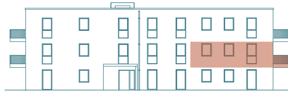
Frontansicht (Ost) - Haus 2