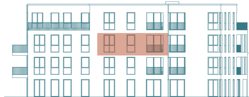
Seitenansicht (West) - Haus 1