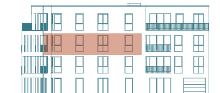
Frontansicht (Süd) - Haus 1