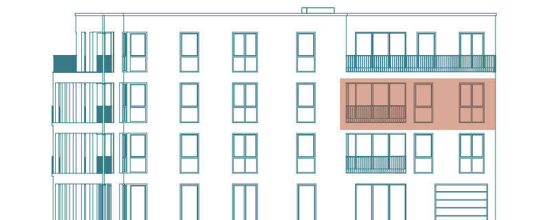
Frontansicht (Süd) - Haus 1