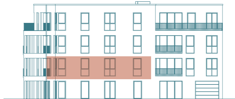
Frontansicht (Süd) - Haus 1