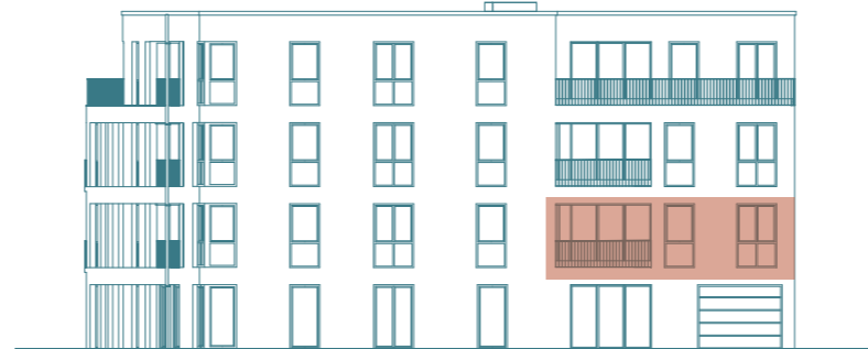
Frontansicht (Süd) - Haus 1