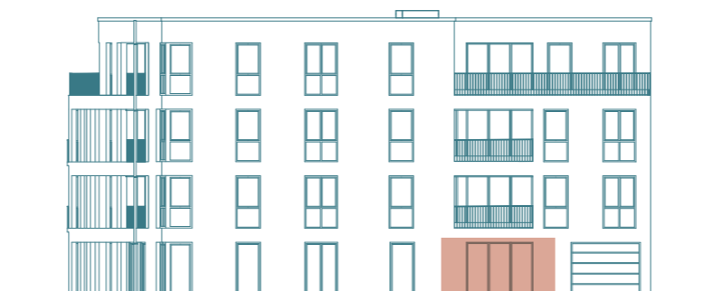
Frontansicht (Süd) - Haus 1